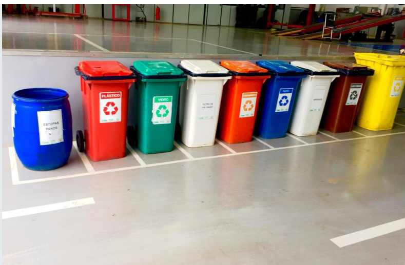
Melhorias na coleta seletiva, destinação adequada dos resíduos sólidos e tratamento dos efluentes chegaram no Grupo Canopus com a certificação ISO14001.