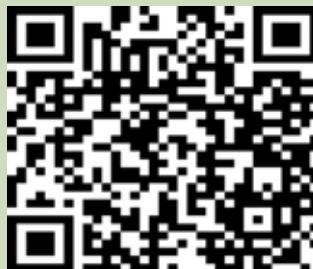
Treinamento – Reestruturação dos Sistemas de KPI Ambientais