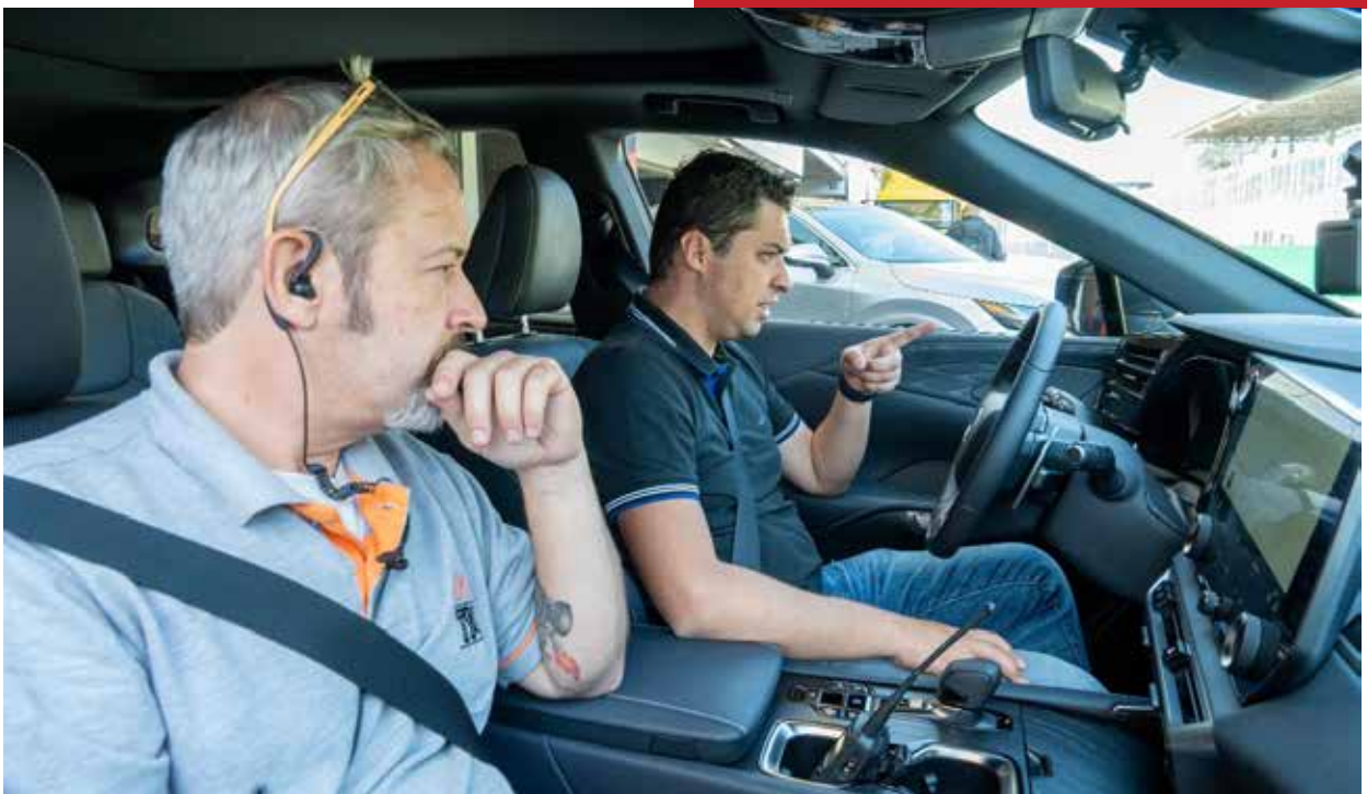
Visitante durante test drive em pista do Autódromo de Interlagos, em São Paulo (SP)

Diante de tanto sucesso, os organizadores já confirmaram a data para do Festival Interlagos – Edição Carros edição 2025, que ocorrerá em 11 a 15 de junho.