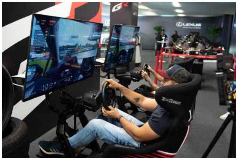
Visitantes brincam no simulador 1x1 no estande da GAZOO

Tauro também ressaltou uma mudança significativa nas vendas do GR Corolla, que antes eram exclusivas das GR Garages, mas agora podem ser realizadas por qualquer Concessionária da marca. “Isso nos